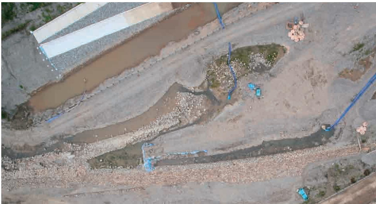
平場および突堤状部分（西より）