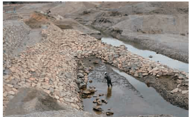
石積み護岸遺構（下流側より）