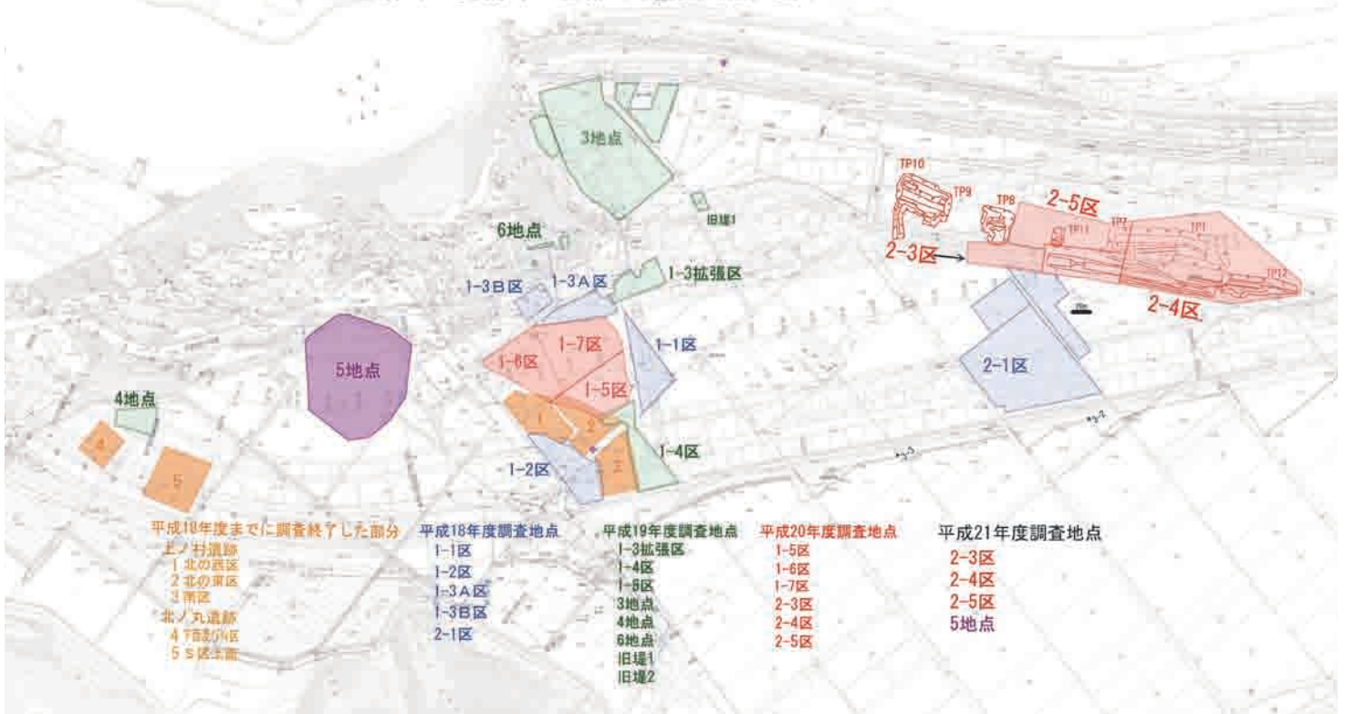
図1 これまで調査を行った場所と本年度の調査区