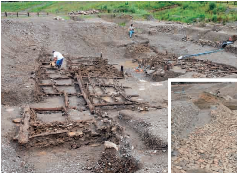
石積み堤防遺構の基礎（南より）