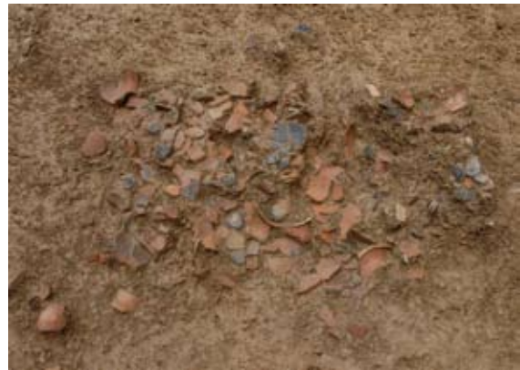
弥生土器出土状況