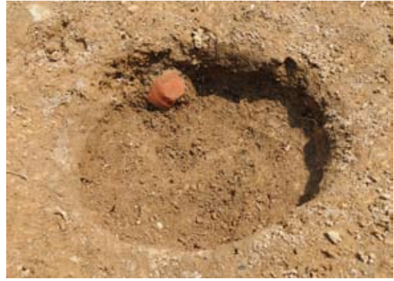
ピット(柱穴)から出土した土師質土器(中世)