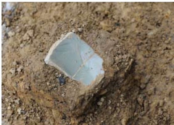
SK25(土坑)から出土した青磁(劃花文・中世)