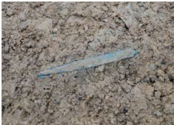
筈(こうがい・中世)