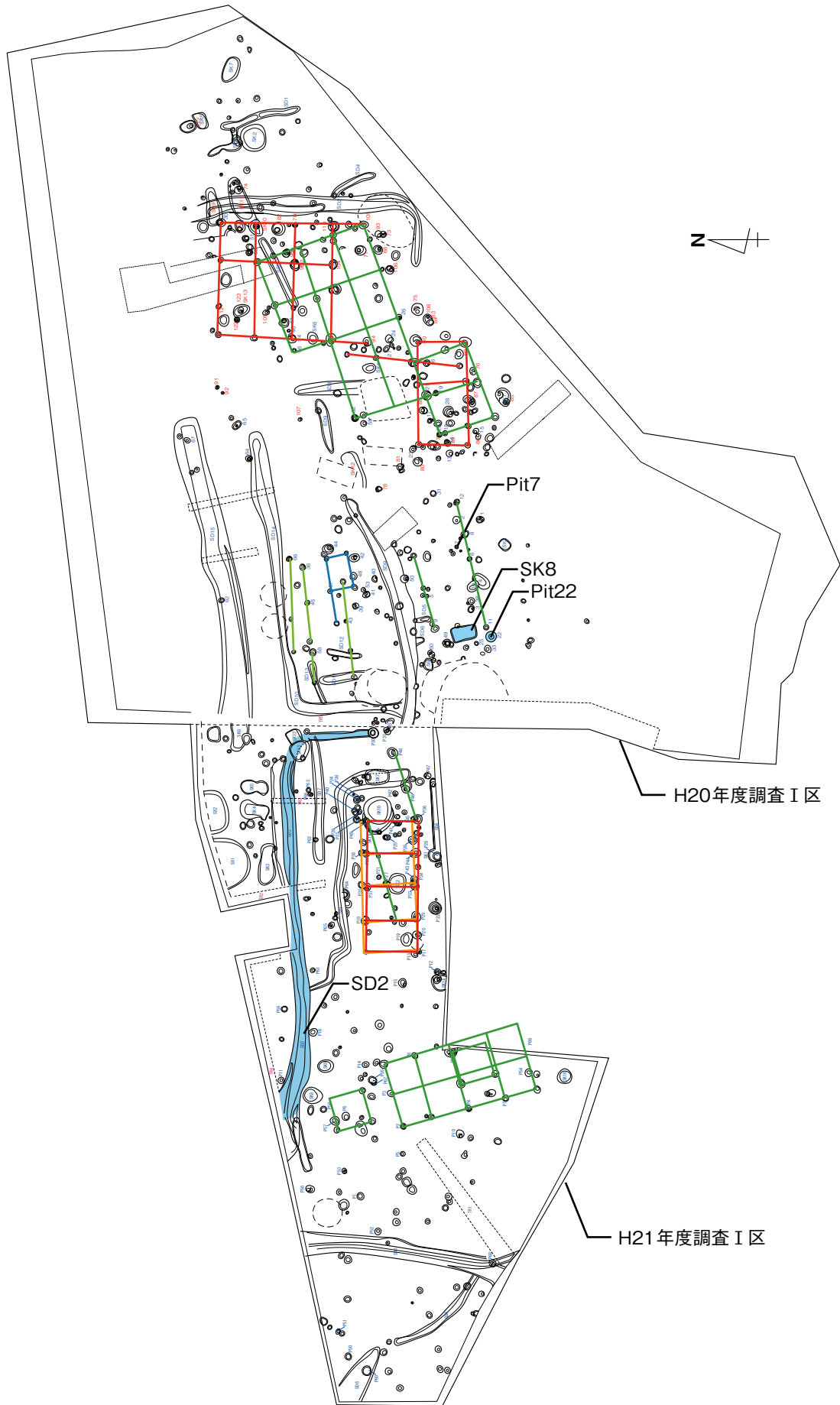
調査 I 区上面遺構 (近世) 配置図 S:1/350