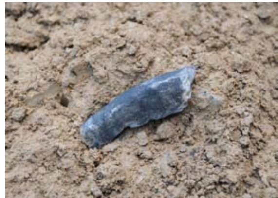
石鍋口縁部出土状態(中世)