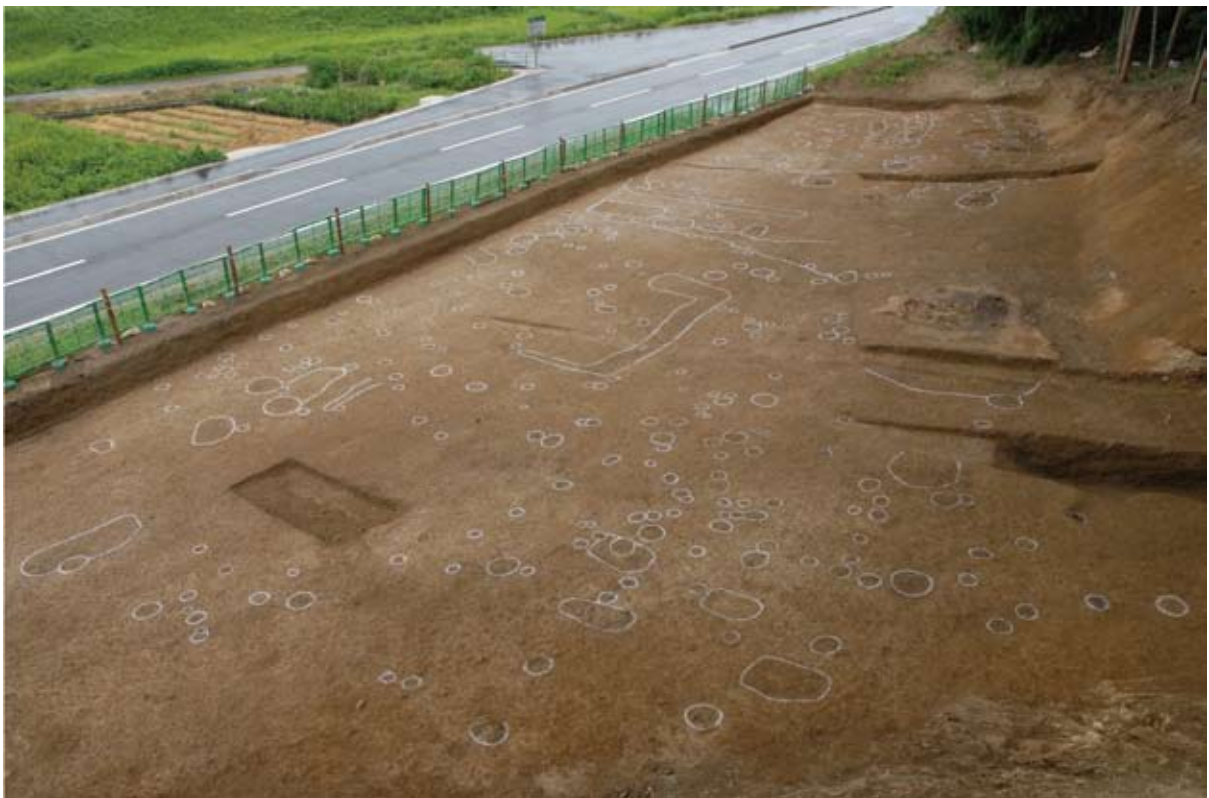
Ⅱ区上面遺構(中世)検出状況(現在調査中)