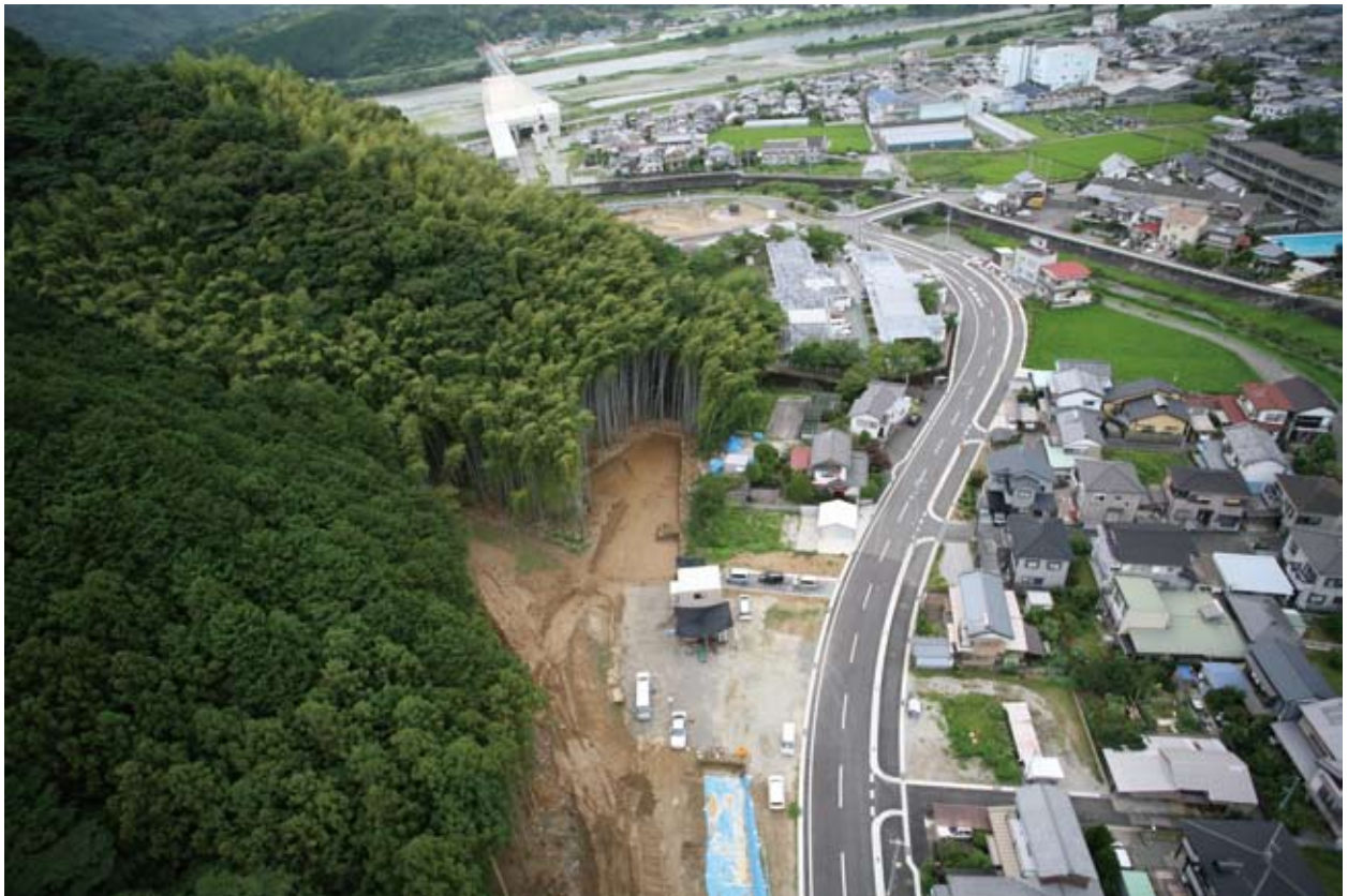
バイパス橋梁工事が進むいの町天神地区東上空より

日時 記者発表 平成21年9月10日(木) 午前10:30～11:30 現地説明会 平成21年9月12日(土) 午後1:30～3:00