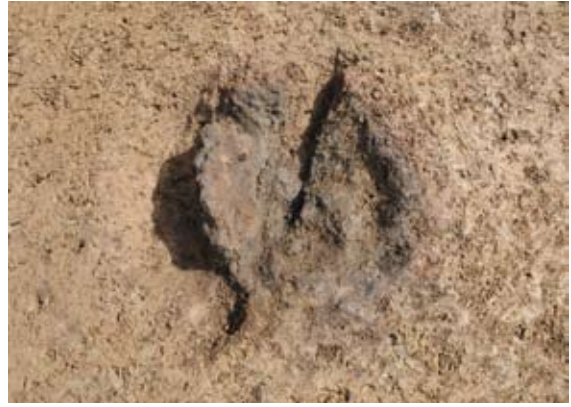
ピット(柱穴)187の椀状鉄滓(古代)