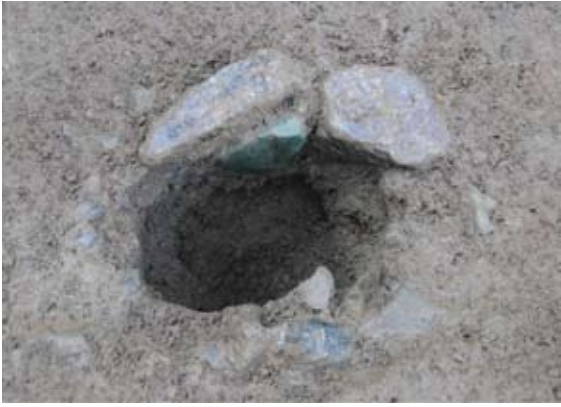
ピット(柱穴)22の巻き石(近世)