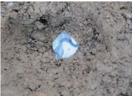
ピット(柱穴)7から出土した青花(中世)