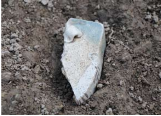
SD2(溝)から出土した織部向付皿