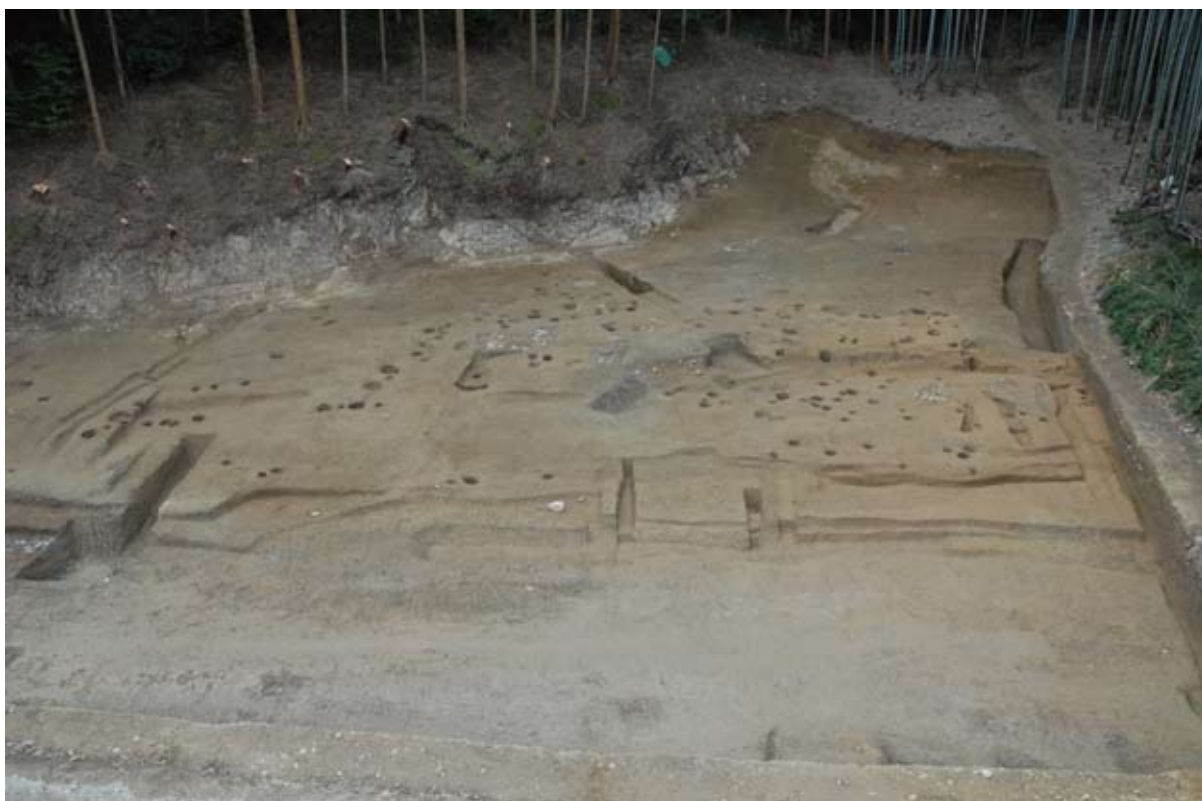
上面遺構(近世)完掘状態(平成20年度調査Ⅰ区)

今年度の調査Ⅰ区の西部では、下層から弥生時代後期後半の土器が一括して廃棄された状態で見つかりました。当該期の土器は、天神遺跡で出土しているものと同じであり、周辺に生活域が展開していることが明らかとなりました。また、昨年度いの町の町道改良工事に伴う発掘調査でこれに先行する弥生時代後期中葉に位置づけられる土坑及び土器が検出されていることから、弥生時代中期末に展開する高地性集落のバーガ森北斜面遺跡から、丘陵裾の平野部への集落の変遷を追う事が出来ます。