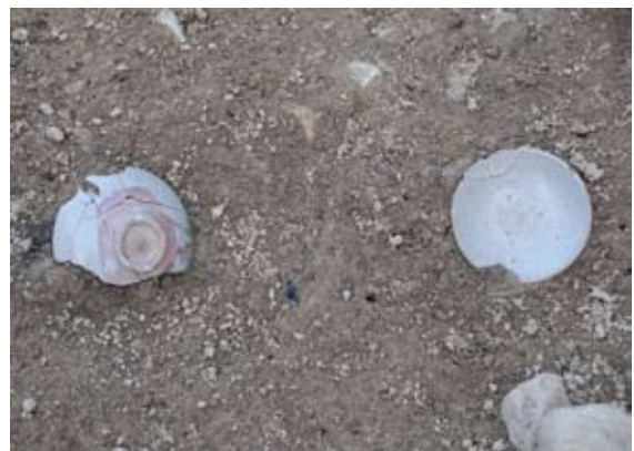
SD2(溝)から出土した唐津灰釉皿