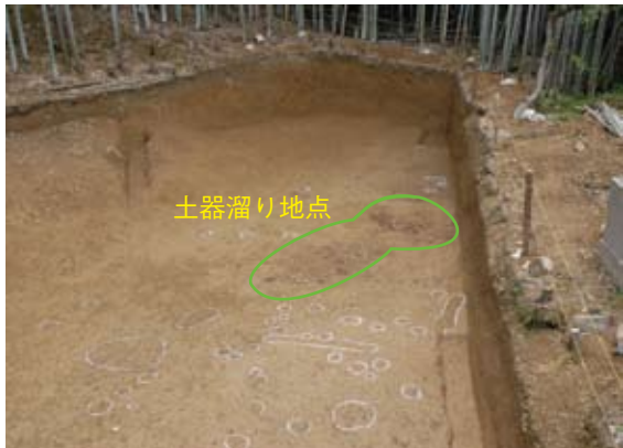
下層遺構(弥生時代)検出状況