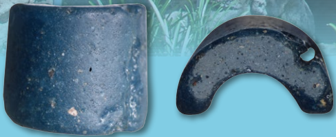
女川遺跡(越知町) ガラス製垂飾品