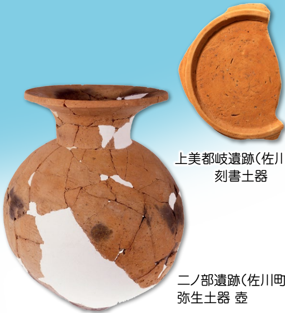
上美都岐遺跡(佐川町) 刻書土器